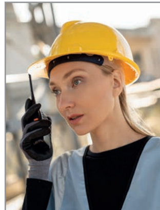
KXBHELMET - Le Havre

Industrie, Transport und Logistik, Brandschutz, Bau, Behörden, Flughäfen, Security