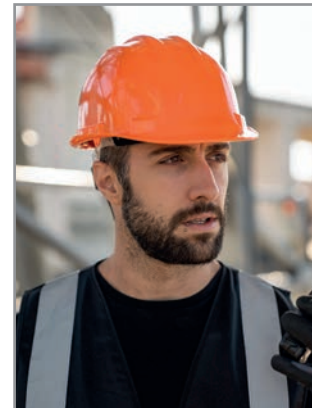
KXHELMET - Grenoble