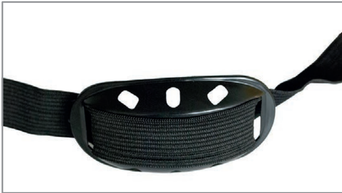
KR100 - Kinnriemen für Helme - Adliswil