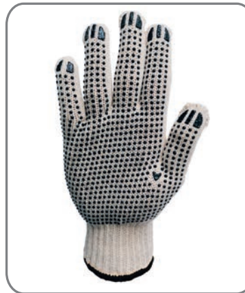
HSGSNS - Größe 10 Farbe: Natur Schwarze Noppen 7 und 10