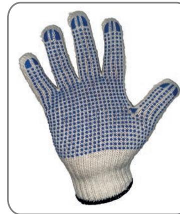
HSGSNB - Größe 10 Farbe: Natur Blaue Noppen 7 und 10