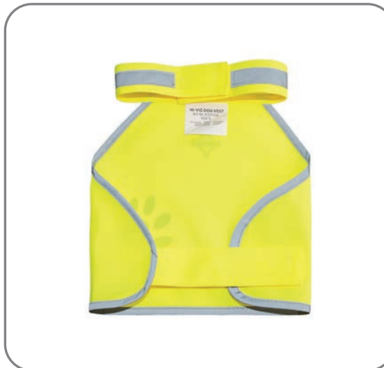
KTH100G / S - XL / Gelb