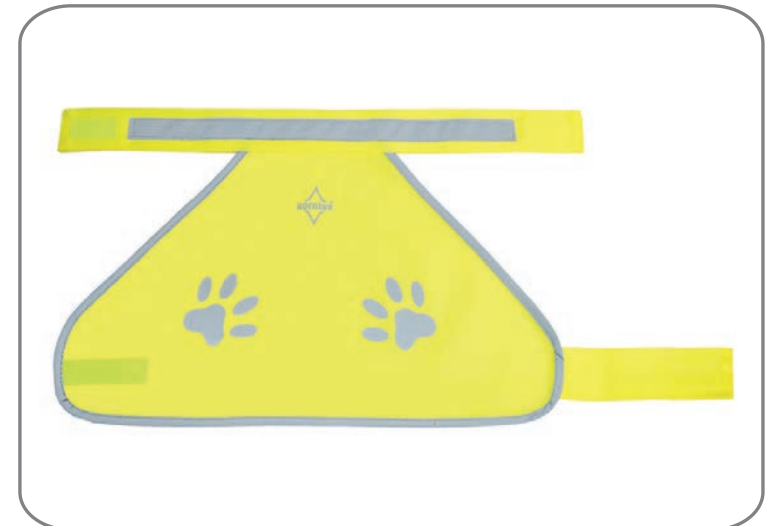
KTH100G / S - XL / Gelb

Material: 100% Polyester Grammatur: 120 gsm